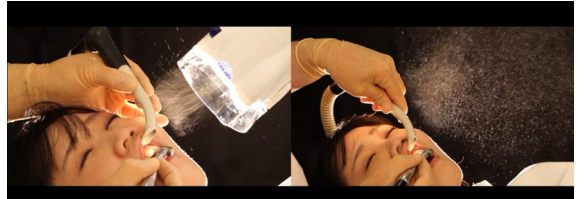
口腔外バキューム あり