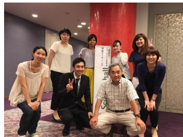
スタッフで記念撮影✧