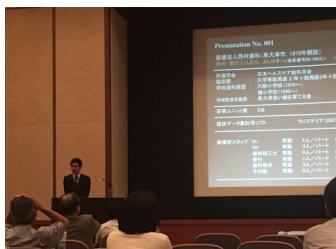
副院長による発表