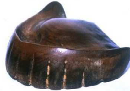
前歯、奥歯もすべて木に彫ってある

日本の木床義歯は、食事をして落ちないように、歯がない上顎の粘膜に吸いつき保持するようにできており、現在の総入れ歯が顎に吸着する理論と同じである。まさに、世界に類のない「木の文化」と日本人の手先の器用さによる「独自の木彫技術」であった。